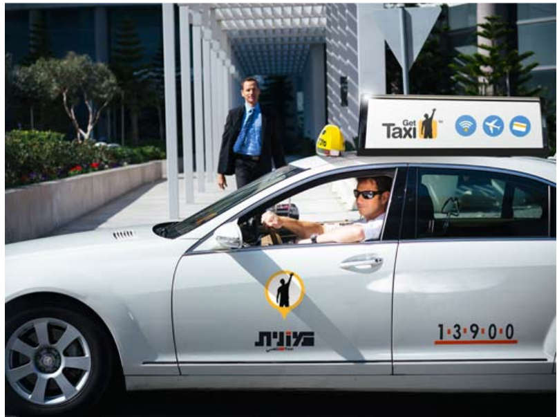
מונית נט טקסי

משרד האנרגיה יעביר חצי מתקציב הפרויקט, שמוערך ב-4.8 מיליון שקל, ועיריית תל-אביב תעביר 400 אלף שקל. שאר הניסוי ימומן על ידי גורמים אחרים, בהם קרסו ואולי גם אפליקציות מוניות דוגמת Gett. מטרת הניסוי היא להוכיח שניתן להטעין מוניות ללא סוללה מתחלפת ותוך שימוש בסוגי טעינה שונים - טעינה מהירה בשעות העבודה וטעינה איטית כאשר המוניות לא פעילות. נזכיר כי חברת בטר פלייס הישראלית, שניסתה לקדם את חזון המכונית החשמלית אבל קרסה, ערכה ניסויים דומים בהולנד, ביפן ובסין.