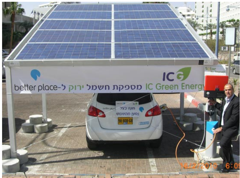
הטענת הרכב החשמלי של בטר פלייס באמצעות אנרגיה סולארית

לפי התוכנית, יוקמו עמדות טעינה בכל פרויקט בנייה חדש ובכל חניון שיוגדר כ"מרכזי". עמדות הטעינה ינוהלו בצורה הוליסטית כדי לא להכביד על רשת החשמל. בניינים חדשים שיוקמו בעיר יחויבו להציע תשתית של טעינה. בנוסף העירייה תסייע לדיירים בבניינים קיימים, דרך חברת עזרה וביצרון, להקים תשתית. העירייה מקווה להסדיר תקנות חדשות שיאפשרו התקנה של עמדות ללא צורך בהיתר בנייה ובלי לקבל אישור של כל הדיירים.