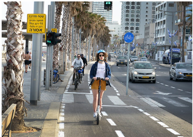
שביל אופניים על טיילת תל אביב

בשלב זה לא יוקמו עמדות טעינה עבור כלי רכב שיתופיים זעירים, כמו קורקינטים ואופניים חשמליים. העירייה מתמקדת בהסדרת התחום ובהכנת רגולציה מחייבת לחברות שמשכירות את כלי הרכב הללו. נציין כי הנושא של קטנועים ואופנועים נמצא בבדיקה.