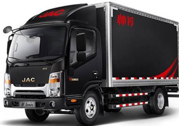
משאית של JAC

היכולת למצוא פיתרון חשמלי למשאיות מושפעת מכך שתחום המשאיות החשמליות בעולם עדיין בחיתוליו. סוללות כבדות פוגעות ביכולת של המשאית לשאת מטען ואילו סוללות גדולות מצריכות טעינה ארוכה במיוחד. עיריית תל-אביב תתמקד בשלב הראשון בכלי רכב מסחריים קלים, למשל ואנים ורכבי חלוקה. העירייה החליטה לוותר על הניסיון להשתמש בגז טבעי, שמזהם פחות מסולר או בניזן, כדלק לכלי רכב כבדים.